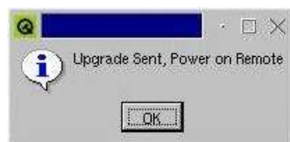
Abbildung 5: Abschluss des Upgrades des Remote-Handgerätes über das Display-Handgerät