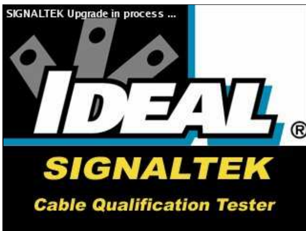
Abbildung 1: Firmware-Upgrade wird ausgeführt