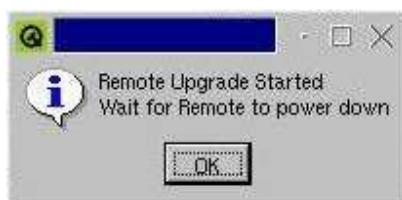
Abbildung 4: Beginn des Upgrades des Remote-Handgerätes über das Display-Handgerät.