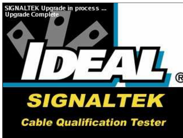
Abbildung 2: Firmware-Upgrade ist abgeschlossen