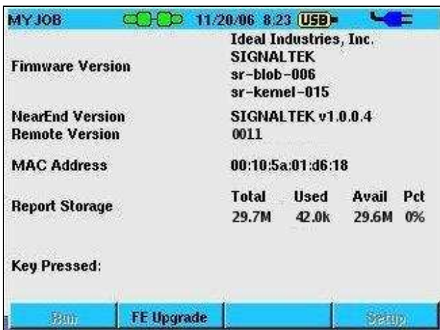
Abbildung 6: Bildschirm Firmware-Version nach erfolgreich abgeschlossenem Upgrade