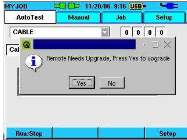
Abbildung 3: Aufforderung zum Upgrade des Remote-Handgerätes