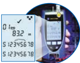
Verdrahtungstest inkl. Länge