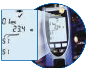
Überprüfung einer Koaxleitung

Auf seinem Weg durch das Kabel wird das Signal durch Impedanzveränderungen verändert, die durch Beschädigungen, Unterbrechungen oder Kurzschlüsse verursacht wurden. Die gemessene Laufzeit des Signals wird in exakte Entfernungsangaben umgerechnet. Die TDR-Funktion hilft, die Position von Verkabelungsfehlern zu ermitteln. Damit beschleunigt sich die Fehlerlokalisierung genauso wie der Eingriff um mögliche Beschädigungen von Kabelhalterungen weitestgehend zu vermeiden.